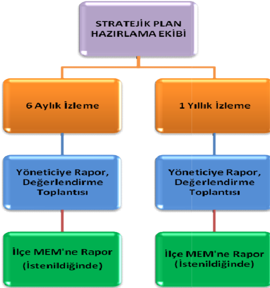
Şekil: Stratejik Plan Hazırlama Şablonu